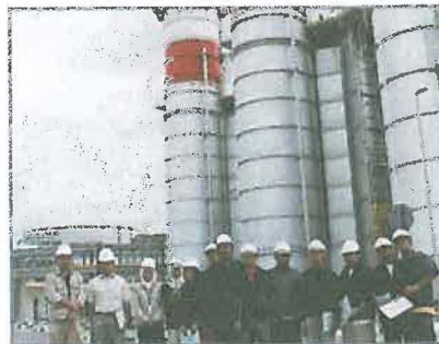
Global E-Technic Sdn Bhd