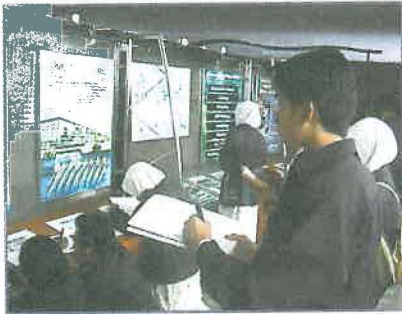
Malaysia Smelting Corporation Berhad