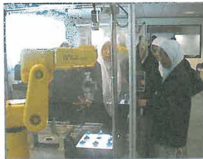
Techno Centre di Kawasan Perindustrian Kulim Hi-Tech Park