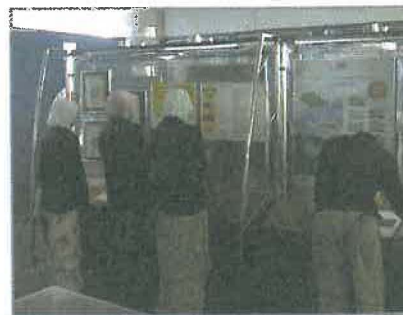
Pentamaster Technology (M) Sdn Bhd