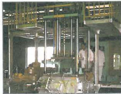
Starton Industrial Sdn. Bhd