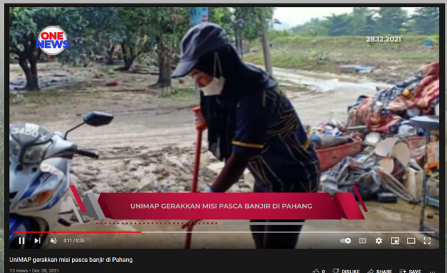
28 DIS 2021 - BERITA TERKINI - 600 SUKARELAWAN UNIMAP BANTU PENYUKUT TERJEJAS DI PAHANG

BERITA TERKINI | JAWAT AWAM JADI SUKARELAWAN PASCABANJIR - KSN | LEBIH 400 KETUA ISI RUMA