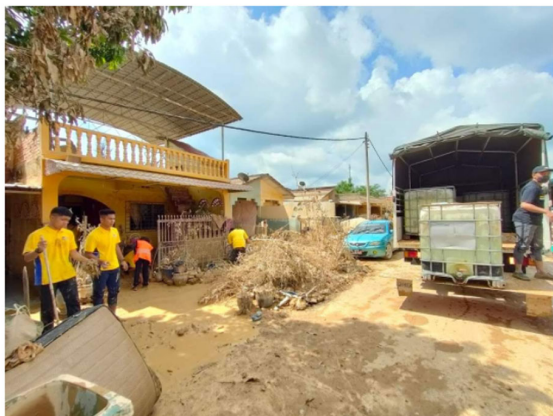
PARA pelajar Unimap bergotong-royong membantu membersihkan kawasan rumah salah seorang penduduk di Pahang dalam Misi Op Pasca Banjir Unimap.

Oleh MOHD, HAFIZ ABD, MUTALIB 28 Disember 2021, 2:08 pm