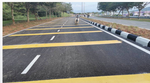
Projek PRE : Naik Taraf Jalan