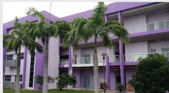
Projek PRE : Mengecat Bangunan