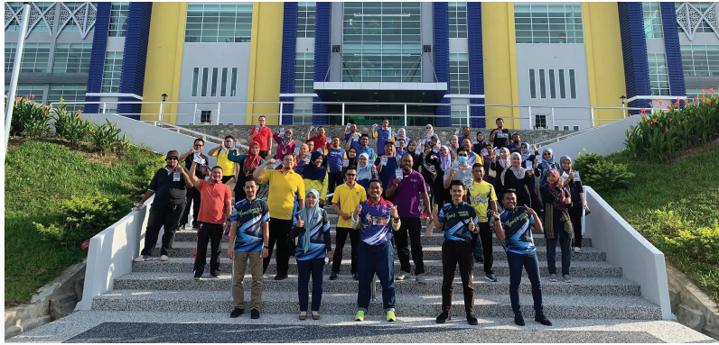
Program Transformasi Minda 2020