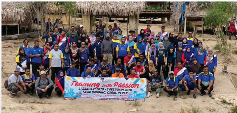
Teaming With Passion 2020