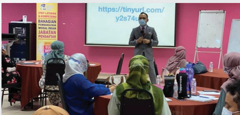
Kursus Imej Dan Keterampilan Profesional 2020