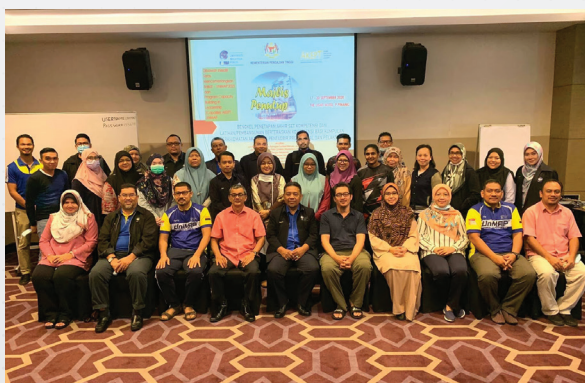
Bengkel Penetapan Kompetensi dan Latihan & Pembangunan Berteraskan Kompetensi Bagi Kumpulan Perkhidmatan Akademik, Pentadbir Profesional dan Pelaksana Universiti Malaysia Perlis

Keseluruhan kursus yang dianjurkan berjalan dengan lancar walaupun pihak Unit Latihan dan Pengukuhan bakat mengalami kesukaran untuk penganjuran kursus berikutan Standard Operating Procedure (SOP) yang telah dikeluarkan oleh Majlis Keselamatan Negara (MKN) dan Guideline For Conducting Face To Face Training During The COVID-19 Pandemic yang dikeluarkan oleh Human Resources Development Fund (HRDF) dalam usaha menangani penularan wabak COVID-19.