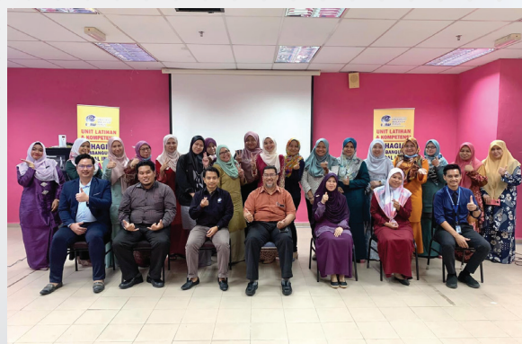
Kursus Penataran Bahasa Dalam Penulisan Dokumen Rasmi