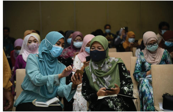
Jerayawara Pengajaran dan Pembelajaran dalam Talian 2.0 @ UniMAP, 5 Oktober 2020, Hotel Seri Malaysia Kangar