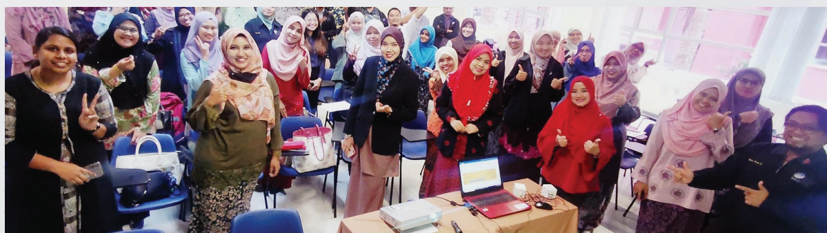
Kursus Bahasa Inggeris Siri 1 Tahun 2020 bagi Tujuan Pengesahan Jawatan, 29 Sept - 6 Okt 2020