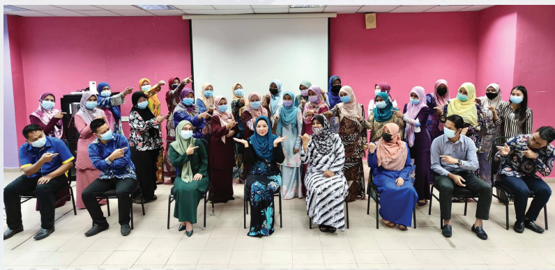
Kursus Komunikasi Khidmat Pelanggan Berkesan