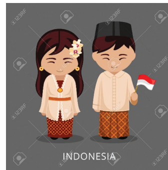
5-6 SEPTEMBER 2019 WORKSHOP ON EVALUATION IMT-GT UNINET STRATEGIC ACTION PLAN 2017-2021 UNIVERSITAS SYIAH KUALA BANDA ACEH INDONESIA