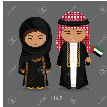
22-30 NOVEMBER 2019 PROGRAM JELAJAH ILMU 15 GEORGIA DAN DUBAI