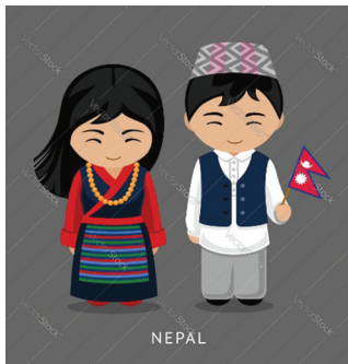
25 - 27 SEPTEMBER 2019 ERASMUS+ REGIONAL SEMINAR FOR ASIA 2019 RADISSON HOTEL KATHMANDU NEPAL