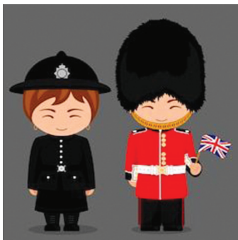
27-30 APRIL 2019 PERSIDANGAN GLOBAL U8 CONSORTIUM (GU8) UNIVERSITY OF HULL UNITED KINGDOM