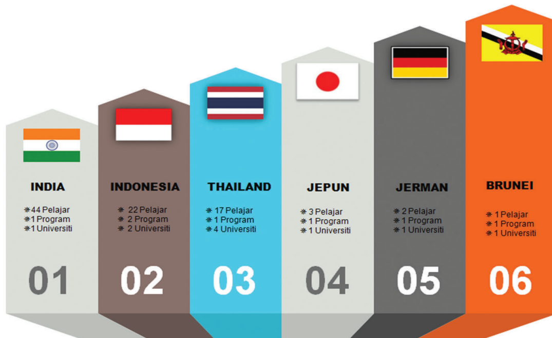
Rajah 11.2: Analisa Program Mobiliti Inbound Pelajar Mengikut Bilangan Peserta /Universiti/Program Dan Negara