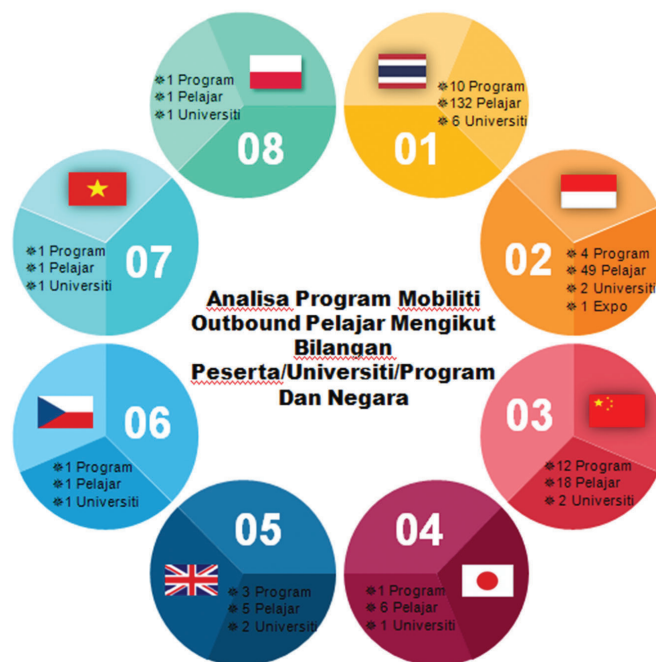
Rajah 11.1: Analisa Program Mobiliti Outbound Pelajar Mengikut Bilangan Peserta /Universiti/Program Dan Negara