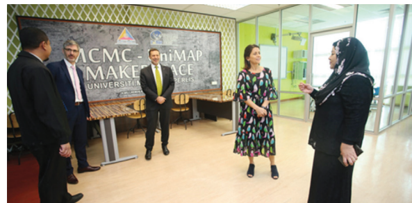
Lawatan Kerja TYT Pesuruhjaya Tinggi Australia ke Malaysia

PTSFP terus dikunjungi oleh pelbagai pelawat dari dalam dan luar negara pada tahun 2019 dengan peningkatan bilangan kunjungan mencapai 41% berbanding pada tahun 2018.