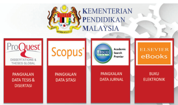
Rajah 13.3 : Profil Tajakan Sumber Maklumat Elektronik 2019

PTSFP mencapai penjimatan bajet melalui tajaan langganan pangkalan data maklumat tersebut. Sehubungan itu, peruntukan sedia ada dimanfaatkan secara optima oleh PTSFP untuk memperbaharui langganan kepada sumber maklumat berimpak yang diperlukan oleh warga UniMAP.