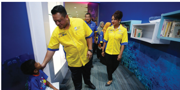
Program Nuri @ the Library

PTSFP melaksanakan pelbagai inisiatif menjadikan perpustakaan ini sebagai hub komuniti - lokasi fizikal yang menjadi fokus pelaksanaan pelbagai aktiviti dan penawaran perkhidmatan serta fasiliti yang boleh diakses oleh komuniti setempat.