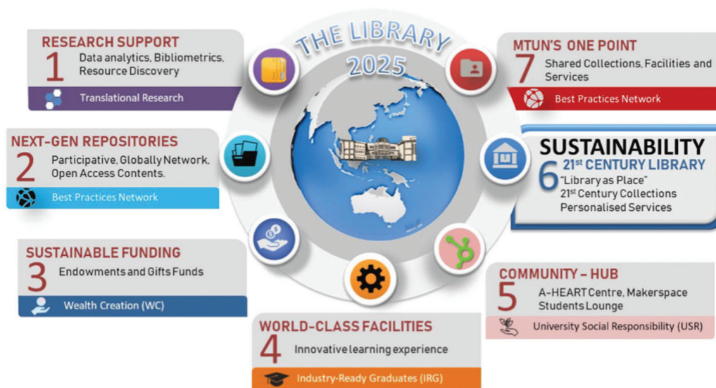
Rajah 13.1 : Hala Tuju Strategik PTSFP 2018-2025

Perpustakaan Tuanku Syed Faizuddin Putra (PTSFP) melalui tahun 2019 dengan pelbagai inisiatif bagi mencapai kelestarian Perpustakaan Abad ke-21. Untuk mencapai hasrat tersebut, Hala Tuju Strategik PTSFP 2018-2025 menjadi rujukan utama bagi mencapai matlamat UniMAP 2025 serta menyokong Pendidikan Abad ke-21 dan era Revolusi Industri 4.0 (lihat Rajah 1).