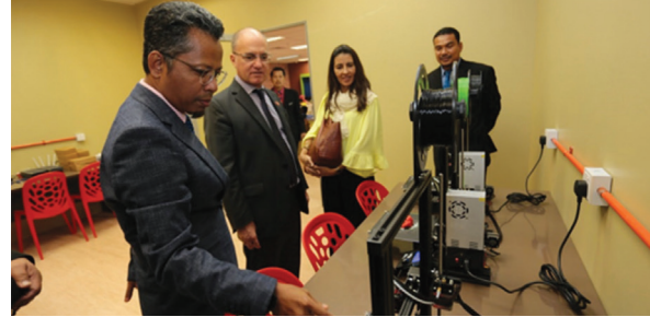
Lawatan Kerja TYT Duta Besar Republik Argentina

53 program yang mengandungi ciri-ciri libat sama komuniti di PTSFP. Inisiatif meningkatkan peranan PTSFP sebagai hub komuniti disangga dengan peningkatan penawaran kemudahan daripada 2 fasiliti pada tahun 2018 kepada 9 fasiliti pada tahun 2019.