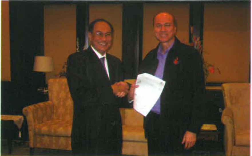
Di kamar Ketua Hakim Negara, Tun Zaki Azmi.

jenayah tersemai dalam masyarakat pada masa hadapan. Sebagai menghargai sumbangan beliau dalam meningkatkan kesedaran bersabit pencegahan jenayah di Malaysia, beliau juga telah dianugerahkan pingat Rakan Polis pada Mac 2012.