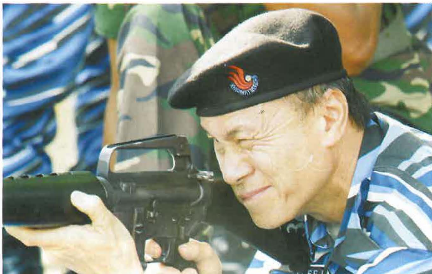
Jati diri: Latihan menembak di Program Latihan Khidmat Negara.

(MMA) Healthcare Services Award (2004), penerima Sathya Sai Life Humanitarian Award (2006), dianugerahkan Toastmasters International Communication and Leadership Award oleh T1 District 51 atas sumbangan dan iltizam beliau dalam bidang pendidikan, pembangunan manusia, hal ehwal kesihatan dan keselamatan serta keprihatinan sosial (2009) dan anugerah Brandlaureate Brand Icon Leadership Award (2011).