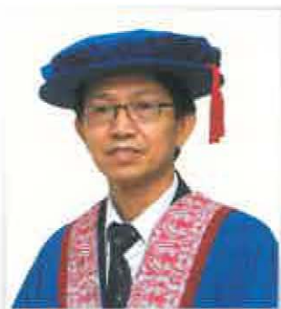
Y. BHG. IR. DR. GUE SEE SEW Ketua Pegawai Eksekutif, G&P Professionals Sdn Bhd.