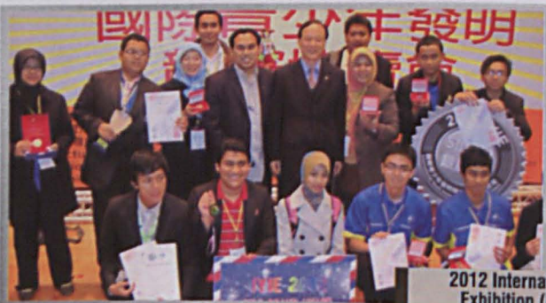
2012 International Youth Invention Exhibition (IYIE) Tainan, Taiwan