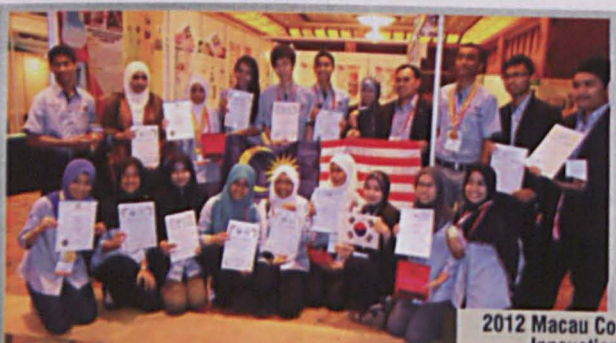
2012 Macau Commuic & International Innovation & Invention Expo