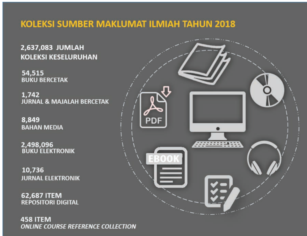
Rajah 13.2 : Komposisi dan Bilangan Naskhah Koleksi Sumber Maklumat Ilmiah Tahun 2018

Falsafah "No Library is an island" merupakan sebahagian daripada agenda menyediakan akses kepada sumber maklumat melalui sistem pembekalan dokumen yang bersifat global dan efektif. Sistem WorldShare Inter-Library Loan dimanfaatkan oleh PTSFP bagi memenuhi keperluan pengguna UniMAP dengan memperolehi bahan-bahan yang tiada di dalam koleksi PTSFP. Rangkaian kerjasama di antara PTSFP dan perpustakaan global membolehkan bahan-bahan berkenaan diperolehi atau dipinjam daripada institusi lain di dalam dan luar negara.